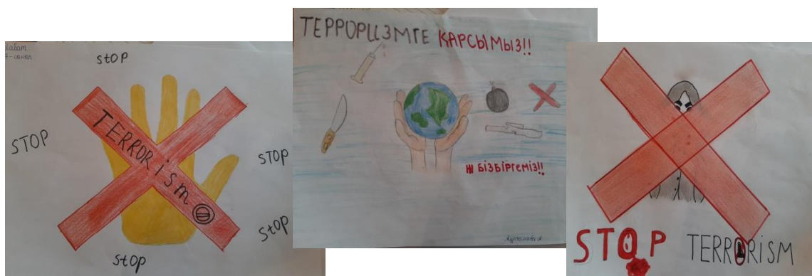
«Жемқорлыққа жол жоқ!» сурет көрмесінен.

Діни секталарға үгіттеуді шектеу мақсатында ата-аналарға түсіндіру жұмыстары жүргізілді. Діни ұйымдарға баратын отбасыларды анықтау мақсатында мақсатында диагностика жүргізілді. Мектеп ішіндегі оқушылардың киім кию ережесі туралы түсінік жұмыстары жүргізу, сақтау, қадағалау туралы жұмыстар жүргізілді. Бос уақыттарын тиімді пайдалану мақсатында мектеп оқушыларын спорттық, мәдени үйірмелерге тарту жұмыстары үнемі жүргізіліп келеді.